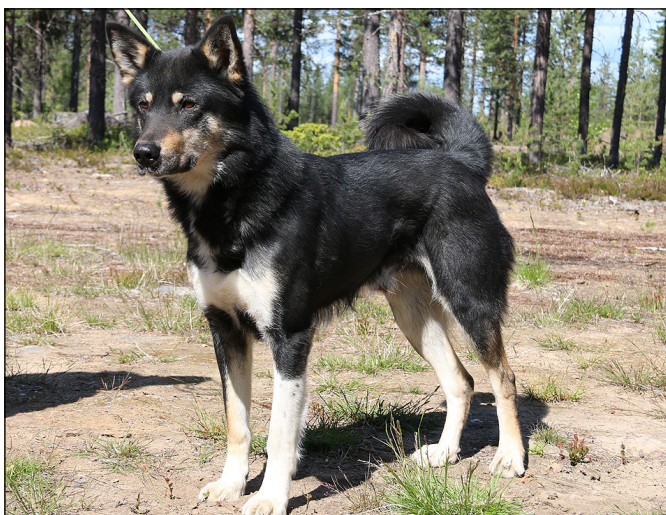
Utmärkt hane med vackert huvud och uttryck med de rätta typiska färgerna.