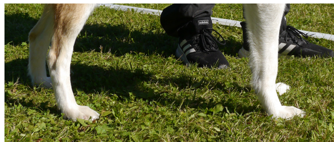
Korrekta tassar, utmärkta mellanhänder och has.