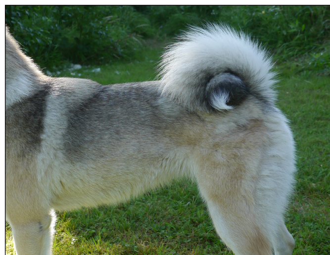
Utmärkt buren svans.