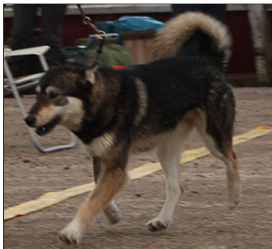
Fria, långsträckta och välbalanserade rörelser.