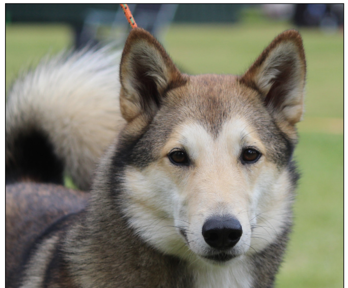
Utmärkt tikhuvud med rätt uttryck, välansatta öron och ögon.