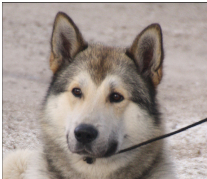
Utmärkt hanhundshuvud med utmärkta ögon och öron samt tydlig könsprägel.