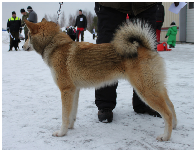
Excellent hane med utmärkt helhet, utmärkt kors och svans, utmärkta vinklar fram och bak.