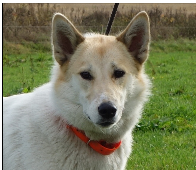
Utmärkt tikhuvud med utmärkta ögon och öron. Fint uttryck och tydlig könsprägel.