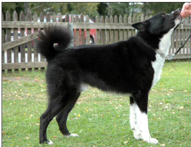
Välkroppad hane med bra vinklar och typisk färg