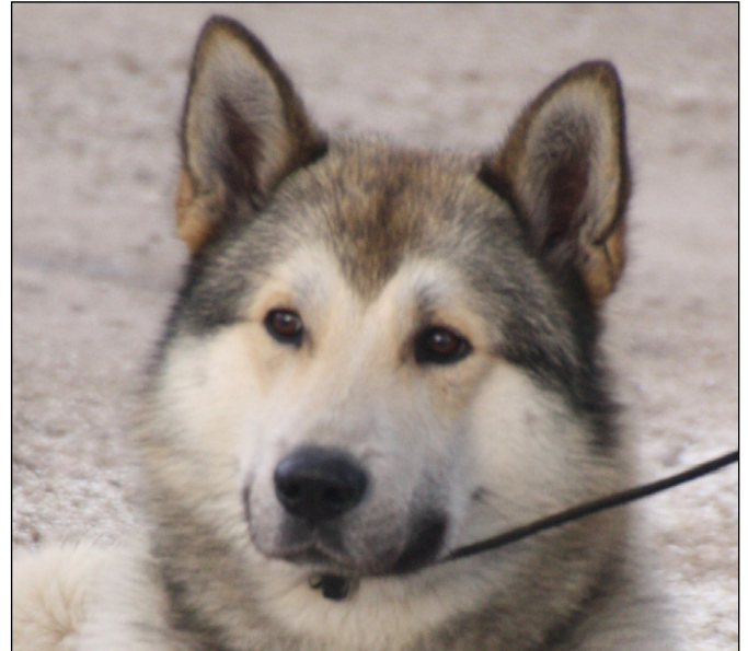
Utmärkt huvud med rätt bredd i skallen, ger det rastypiska uttrycket.