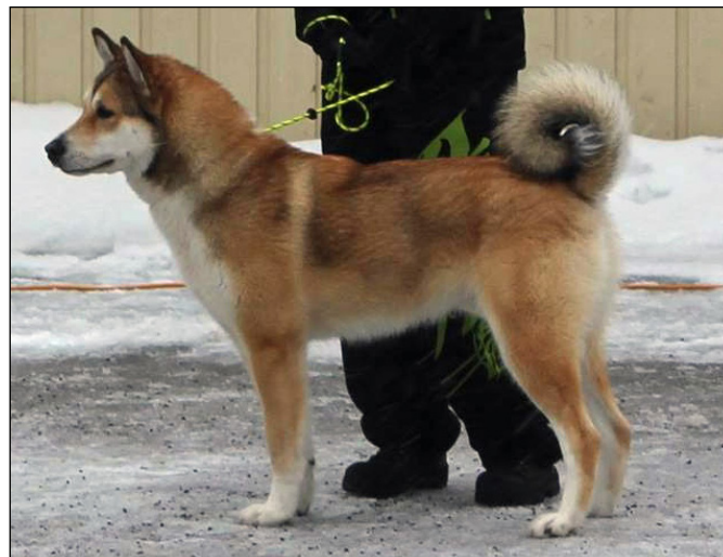
Välkroppad hane med vackert uttryck, lagom höjd och längd.