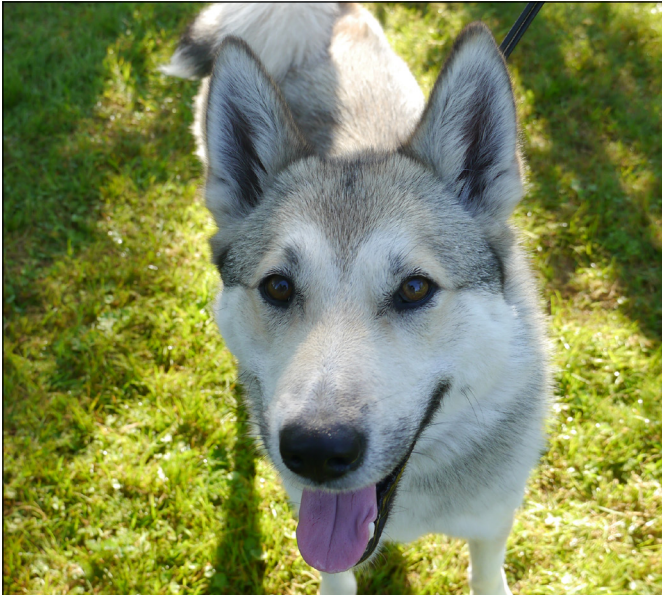
Utmärkt huvud med den breda liksidiga skallformen.