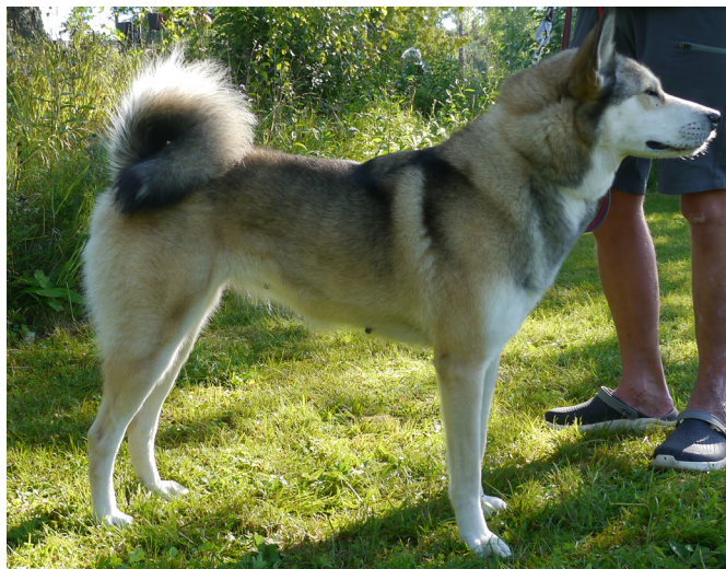
En hane och tik av utmärkt typ med rätt helhetsintryck och med rätta måttförhållanden.