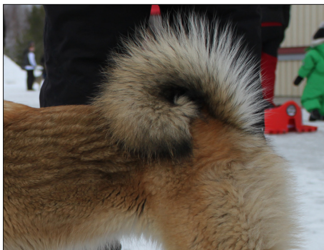
Utmärkt buren svans.