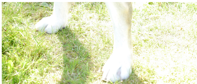
Väl slutna tassar