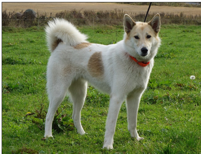
Excellent tik med utmärkt huvud och uttryck, korrekt svans.