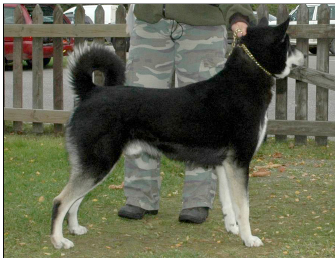
Bilden skall illustrera hals, manke, lämpligt brösdjup och kraftigt uppdragen buklinje.