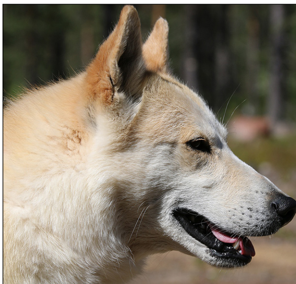
Lämpligt markerat stop, utmärkta ögon och öron, maskulint huvud.