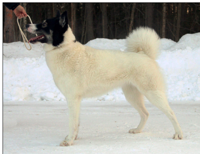
Utmärkt juniortik med de rätta typiska färgerna.