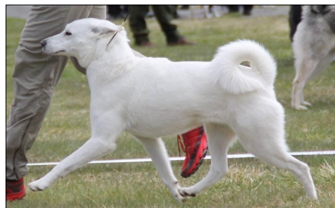
Stabila rörelser med mycket god steglängd både fram och bak samt stram och stark överlinje.