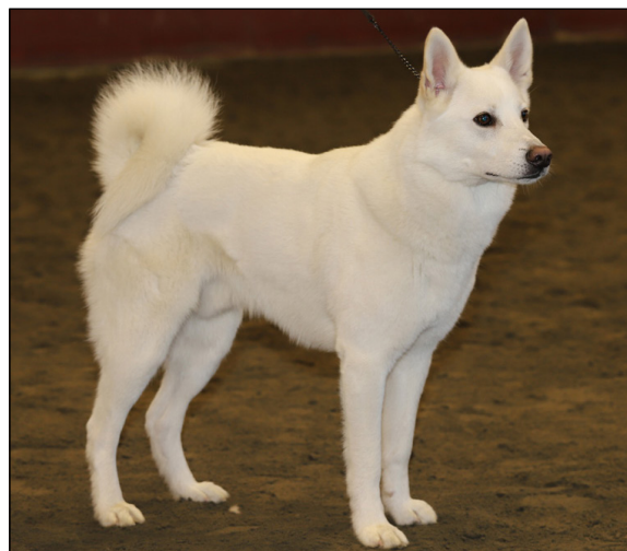
Hundar av utmärkt typ och helhet där det kan finnas något mindre detaljfel.