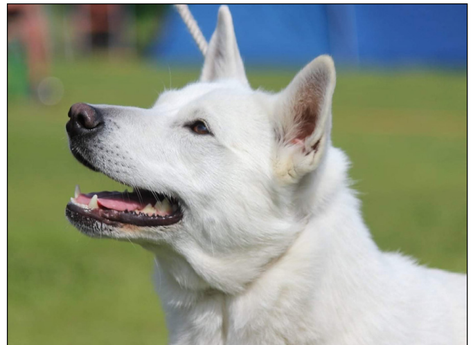
Feminint välformat huvud. Vackra mörka ögon. Välplacerade öron av bra storlek. Bra pigment och bra uttryck.