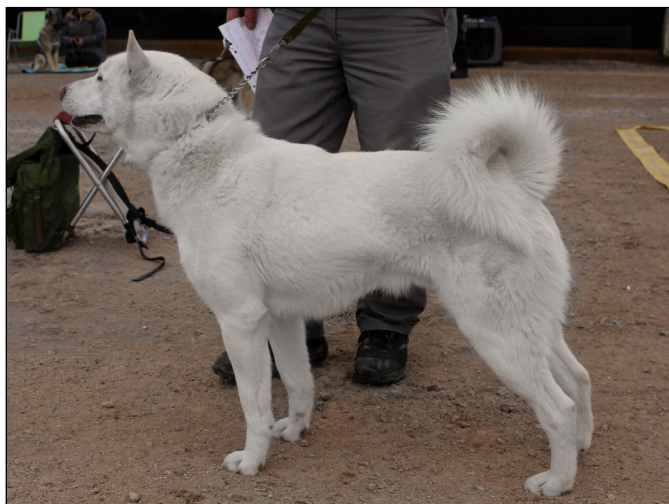
Hane med utmärkt helhet och fina rasdetaljer. Utmärkt päls, färg och svans. Utmärkta vinklar runt om.