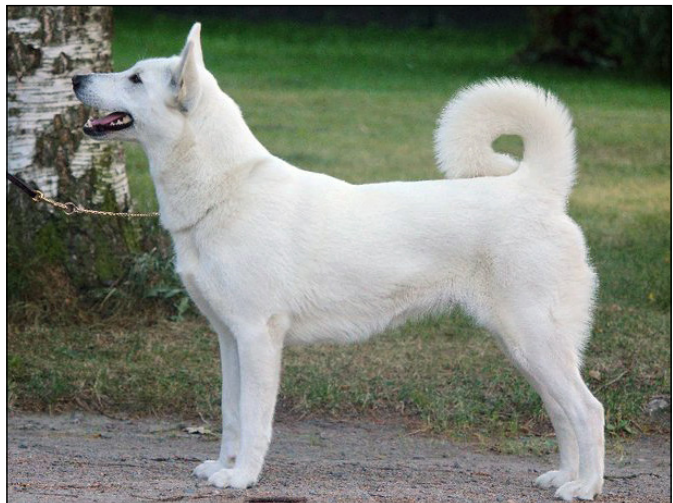
Tikar med utmärkt helhet och de flesta rasdetaljer på plats.