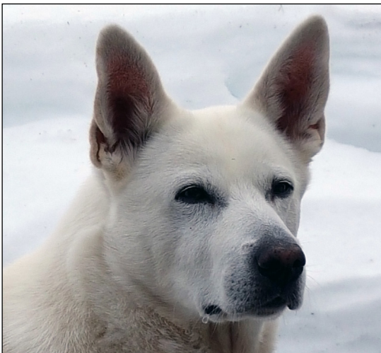
Maskulint välformat vackert huvud. Mörka fina ögon. Något stora öron men fin öronplacering. Bra pigment och fint uttryck.