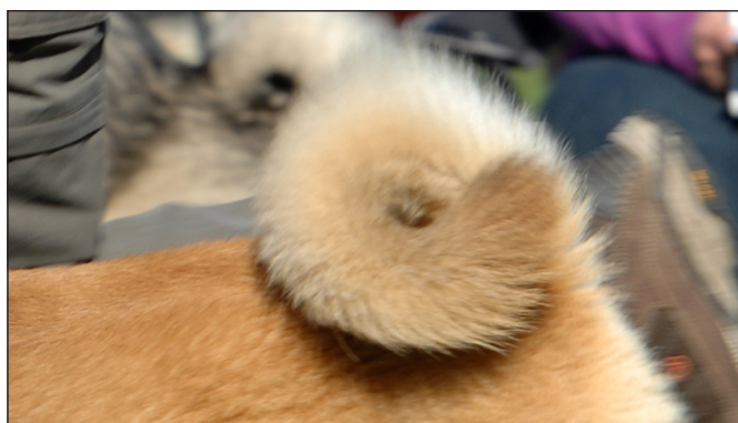
Korrekt ansatt men något kort svans.