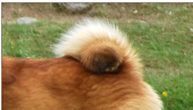
Något hårt ringlad svans.

Svansen får inte vara för hårt ringlad. Noteras i kritiken och bör beaktas i konkurrenssklass.