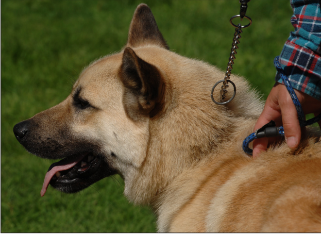
Utmärkt skuret huvud, något lågt ansatta öron.

Stopet skall vara tydligt markerat, utan att vara brant eller djupt.