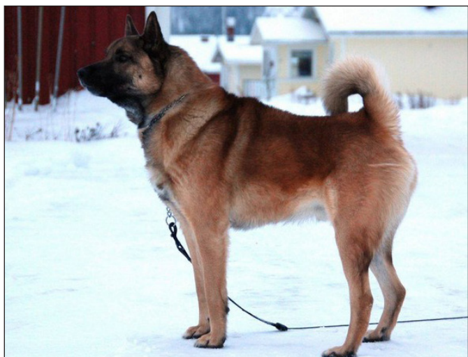
Allt för öppna vinklar både bak och fram.

Frambenen skall vara torra, kraftiga, raka och parallella. Benens längd skall vara minst halva mankhöjden.