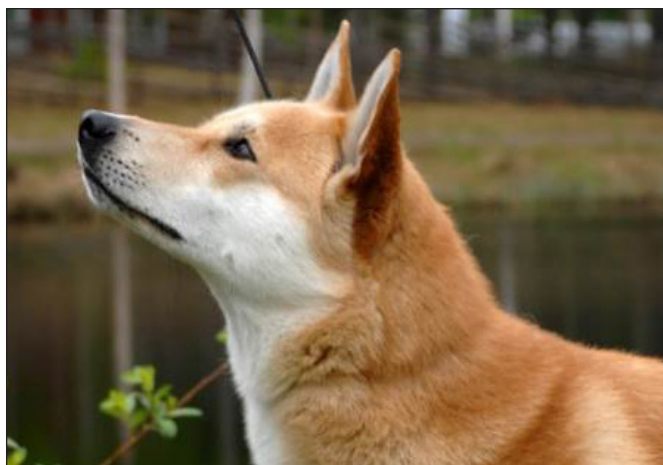
Avsaknad av mörk mask utesluter inte från CK/Cert. Vid rangordning av två i övrigt likvärdiga hundar skall dock svart mask premieras.