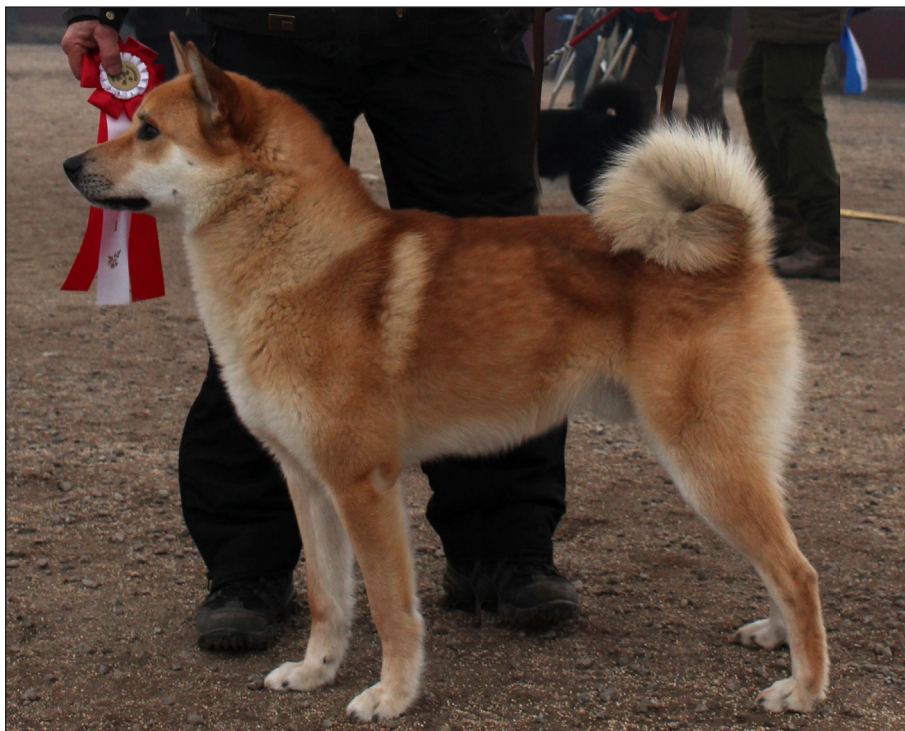
Hane med en utmärkt helhet och fina proportioner. Utmärkt hals, manke och överlinje. Korrekt kors och svans.

Hos hanhundar måste båda testiklarna vara fullt utvecklade och normalt belägna i pungen.