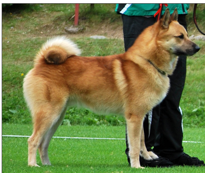
Hane med bra bål och benstomme men något hårt ringlad svans.