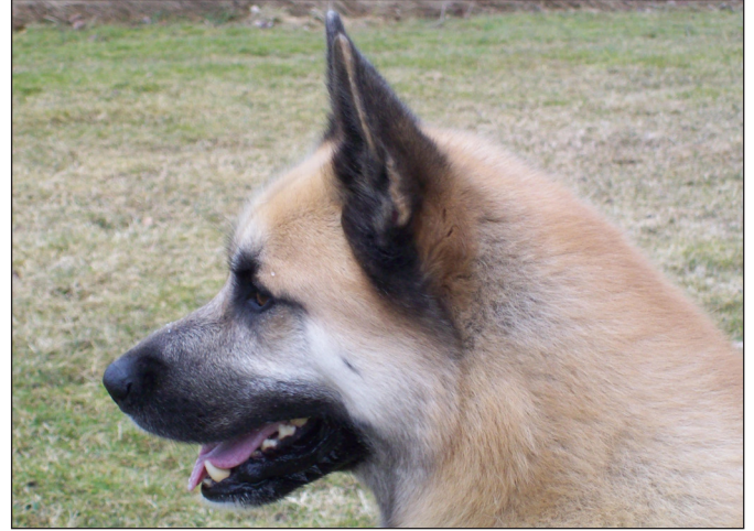
Huvud med något kullrig panna och hårt markerat stop men utmärkt ansatta öron.