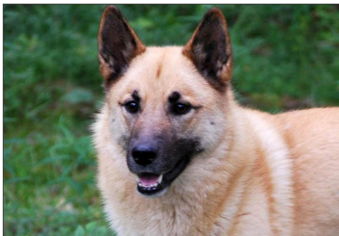
Önskvärt: Hund med utvecklad svart mask.