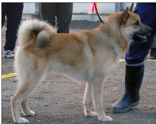
En allt igenom excellent hane.