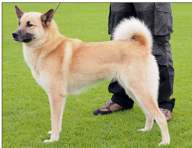
Tik med bra bål och kroppslängd, utmärkt lårbredd men något klen vinklad.