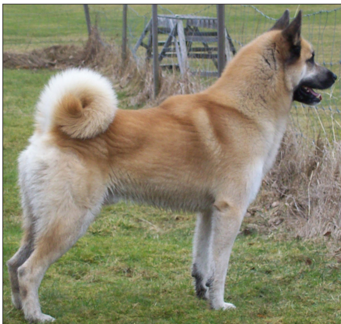
Excellent hane med utmärkt resning och helhet.