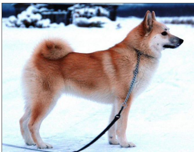
Mycket god tik, på den tyngre sidan, med något långt nosparti.