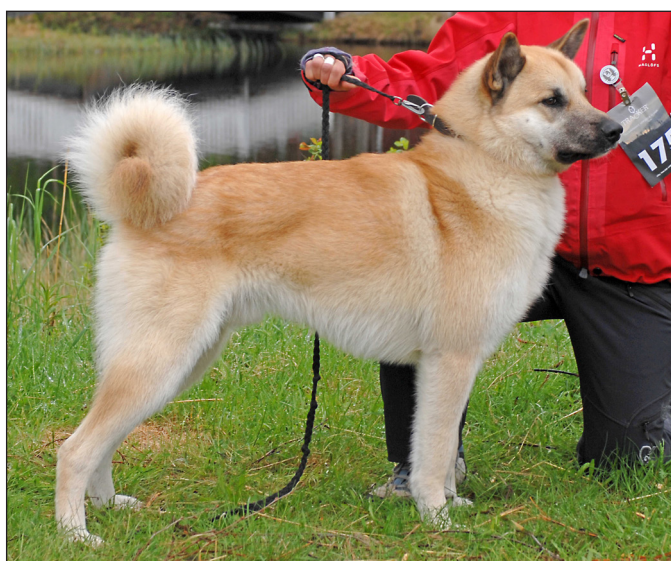
Hane av alltför feminin typ. Kort bröstborg och uppdragen buklinje.

Bälens längd skall något överstiga mankhöjden d.v.s. rektangulär kroppsform.