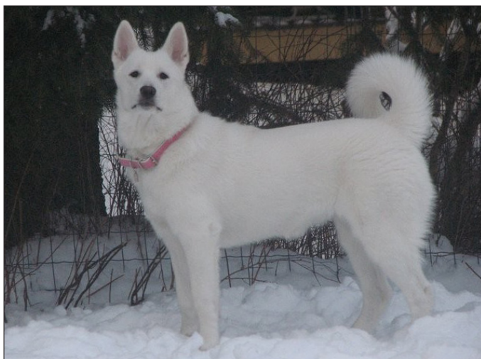
Utmärkt ungtik med utmärkta proportioner och rastypiskt uttryck. Står dock här något underställt.

Hund vars mentalitet inte medger hantering på grund av aggressivitet eller extrem flyktbenägenhet skall tilldelas Disqualified. Hund som i hög grad försvårar bedömning eller mätning kan tilldelas KEP.