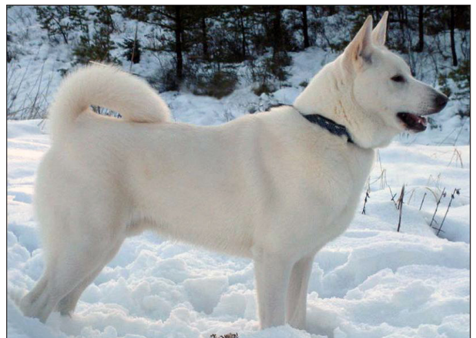
Utmärkt hane med utmärkt helhet, torr men ändå kraftfull. Utmärkta vinklar i skuldra och lår. Utmärkt kors och svans. Ett grovt och sträckt halsband förstärker ett något löst halsskinn.