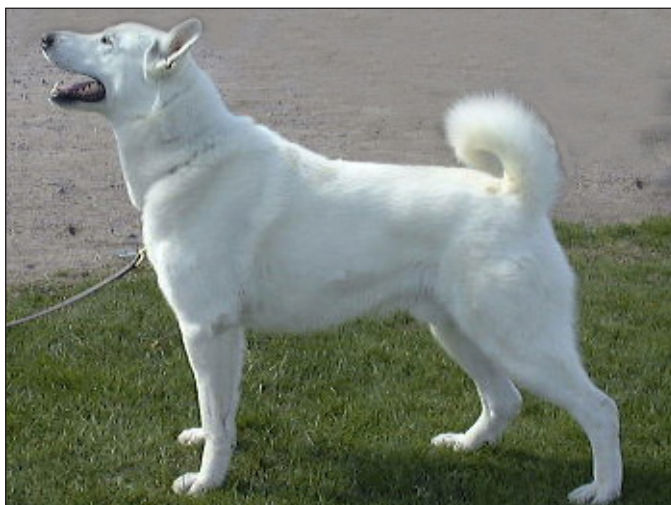
Utmärkt hane med utmärkt helhet. Fina rasdetaljer. Utmärkta vinklar i skuldra och lår.