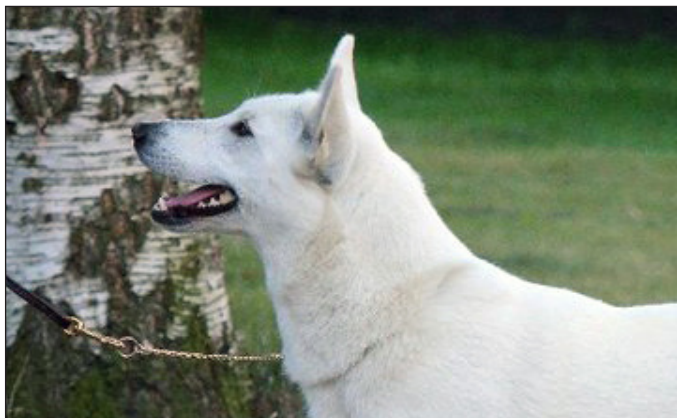
Utmärkt tikhuvud med utmärkt pigmentering, utmärkta ögon och öron. Utmärkt stop.

Stora öron bör uppmärksammas. Observera dock att rasen skall ha relativt brett ansatta öron. Rasens godmodighet gör att hundarna inte alltid bär öronen rätt upp - detta skall inte förväxlas med mjuka öron.