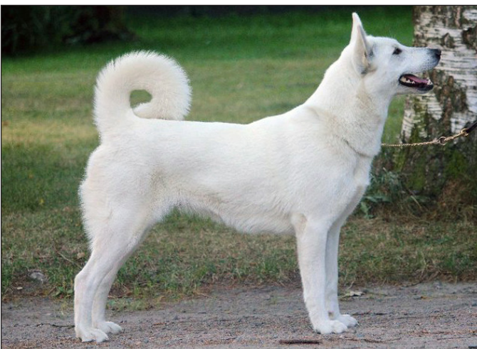
Utmärkt tik med utmärkt helhet och de flesta rasdetaljer på plats.

Den idealiska svansen är av tillräcklig längd och som bäres löst ringlad. Tunn piskformad svans är inte önskvärd och skall vara prisnedsättande. Hårt ringlad s.k gråhundssvans är inte önskvärd och skall inte tilldelas CK.