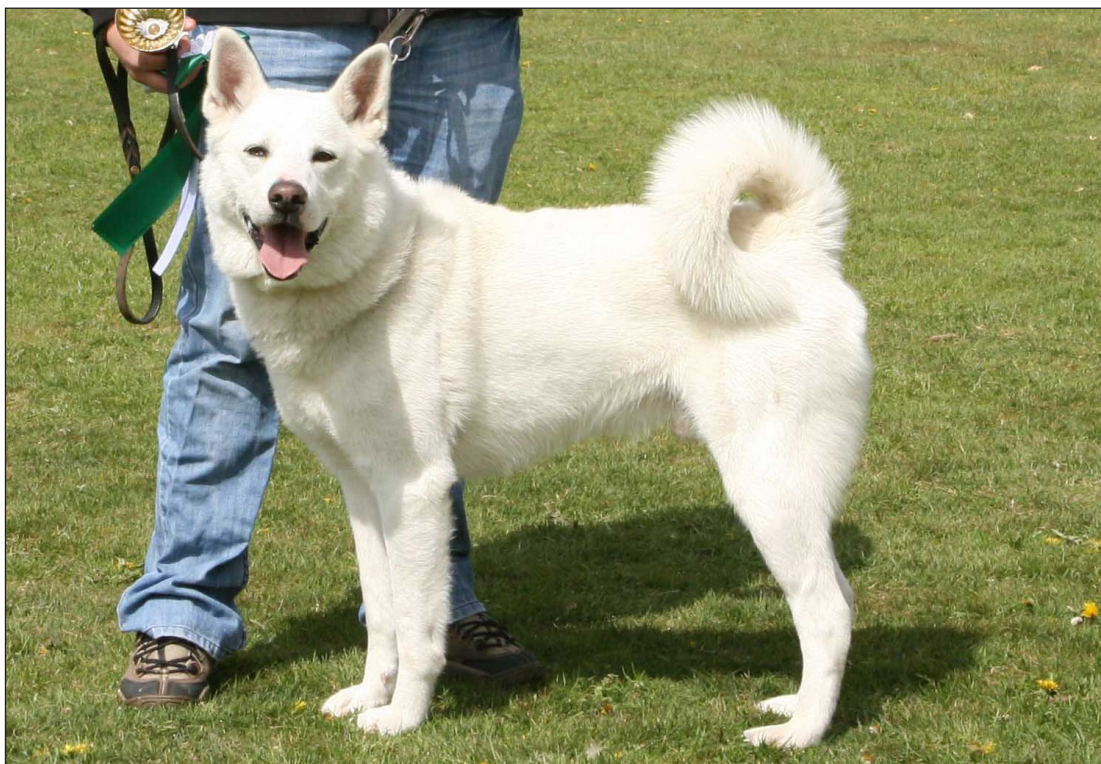
Utmärkt hane med fint uttryck. Utmärkta ögon och lämpligt stora öron. Bra pigmenterad. Utmärkt skulderparti. Vrider sig mot kameran och kan därför upplevas något kort.

Hos hanhundar måste båda testiklarna vara fullt utvecklade och normalt belägna i pungen.