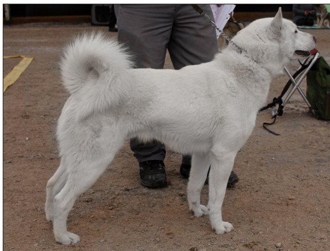
Utmärkt hane med utmärkt helhet och fina rasdetaljer. Utmärkt päls, färg och svans. Utmärkta vinklar runt om.

1993 kom att bli betydelsefullt år för den svenska vita älghunden. Under en helg arrangerades en stor träff i Storhogna. Första dagen var det mönstring och konferens. Dagen därpå hölls en utställning med 77 deltagande hundar och helgen avrundades med ett årsmöte. Samma år godkändes rasstandard och rasklubben blev ansluten till SÄK.